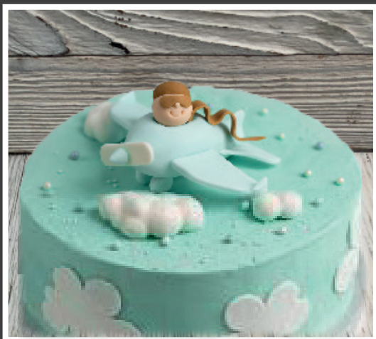
Über den Wolken

Die 10cm & 15cm hohen Torten können NICHT als Rahm- oder Quarktorte hergestellt werden!