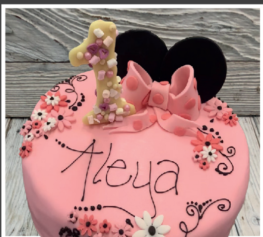
Mickey & Minnie Mouse

Die 10cm & 15cm hohen Torten können NICHT als Rahm- oder Quarktorte hergestellt werden!