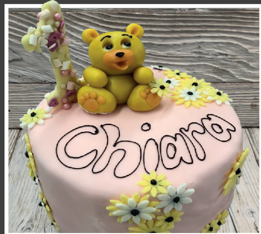
Bärli mit Zahl

Die 10cm & 15cm hohen Torten können NICHT als Rahm- oder Quarktorte hergestellt werden!